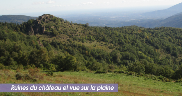
Ruines du château et vue sur la plaine