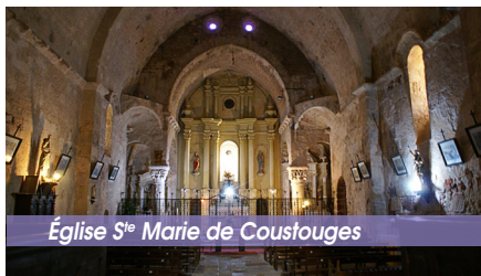
Église S te Marie de Coustouges