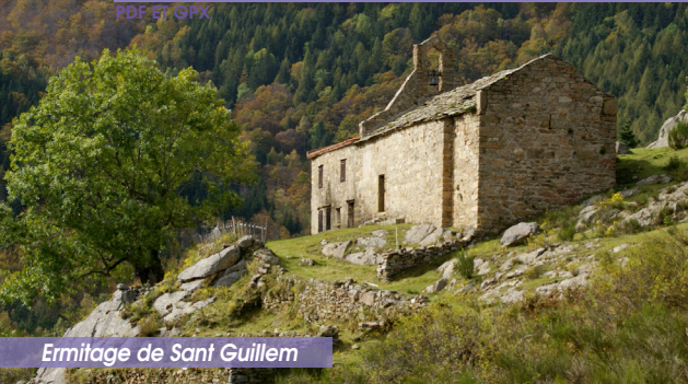
Ermitage de Sant Guillem