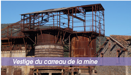
Vestige du carreau de la mine