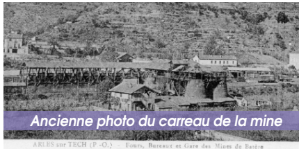
Ancienne photo du carreau de la mine

provenait principalement du site de Batère, perché plus haut sur les flancs montagneux (entre 1150 et 1700 m) du Pic St Pierre et du Pel de Ca. La matière première en descendait par un câble téléphérique long de 9 km jalonné de petits wagonnets suspendus. Une fois traité, le minerai partait par rail jusqu'à l'usine située juste à côté de la gare du chemin de fer desservant le Haut Vallespir depuis 1898 (l'actuelle gare routière). Le site est désormais dédié aux concerts de plein air (Cali s'y est notamment produit).