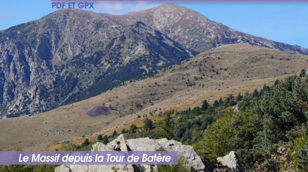
Le Massif depuis la Tour de Batère