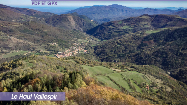
Le Haut Vallespir