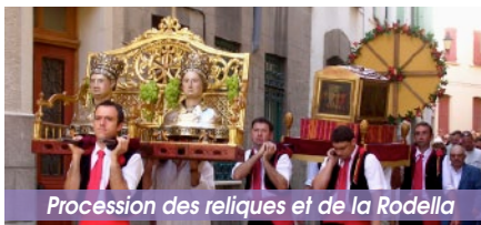
Procession des reliques et de la Rodella

Notre berger s'empressa de faire son rapport au curé qui décréta qu'une reconnaissance éternelle de la communauté villageoise serait désormais de rigueur et c'est ainsi que naquit la Rodella (un ruban de cire de 8 kg enroulé en spirale autour d'une croix piquée de fleurs).”