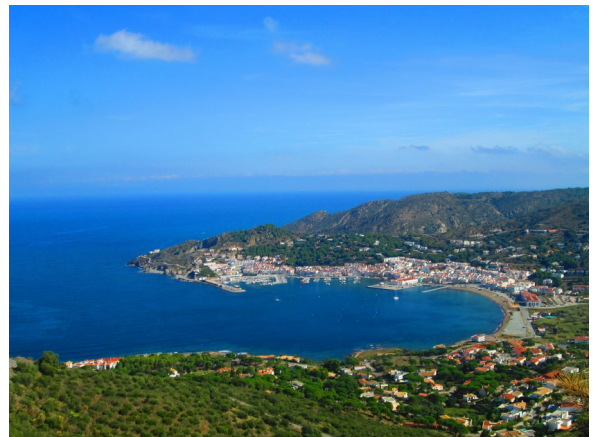
(Port de La Selva)

62,000 km : A l'entrée de Cantallops, repérer sur la droite d'un bâtiment la rue «Carrer Juan Maragall», puis le «Carrer Progrés» (un rapide gauche / droite).