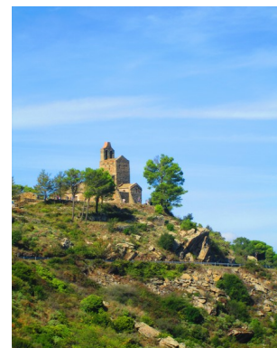
(Chapelle Santa Héléna)

75,600 km : En plein centre du village, partir à droite et quitter Mollet en suivant l'indication «Rabos»